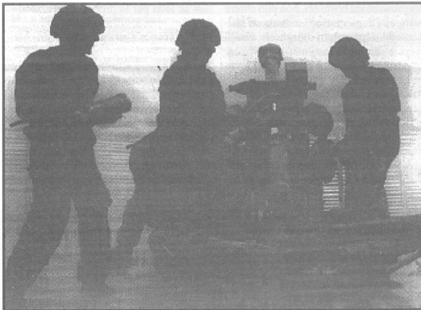
Truppe francesi in Bosnia: «peace keeping» (per portare la pace)?

Le cause della crisi sono molteplici e interdipendenti: il crollo nel 1989 dello stalinismo; la mancata rivoluzione politica antiburocratica nei Paesi cosiddetti "socialisti"; il tentativo della burocrazia che dirigeva il Pcj di saltare sul carro dei vincitori (l'imperialismo); le epurazioni nel Pcj negli anni venti-trenta fatte da Tito e Stalin che impedirono il maturare di una rottura reale con la burocrazia sovietica; l'impossibilità di costruire il socialismo in un paese solo e la conseguente nascita negli anni ottanta — in