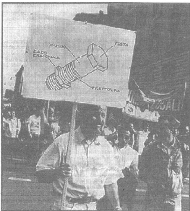
Milano, settembre 1992: contro i vertici di Cgil, Cisl e Uil esplode la "contestazione dei bulloni"

Tutto ciò sapendo che sarà poi lo sviluppo concreto dello scontro, non solo all'interno delle organizzazioni confederali, ma anche sul piano sociale e politico (incluso il rapporto tra Prc e forze del centrosinistra) che determinerà se, nel prossimo futuro, vedremo perpetuarsi l'attuale situazione organizzativa o, invece, maturare le condizioni per la costituzione di un nuovo sindacato di classe di massa in cui saranno organizzativamente uniti l'insieme dei comunisti. ■